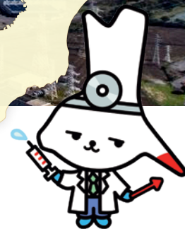
神栖市イメージキャラクター 「カミスココくん」