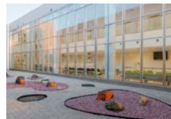
医療法人 玉心会 鹿嶋ハートクリニック 茨城県 神栖市平泉1-168 TEL 0299-77-8888