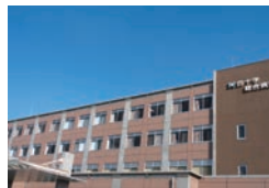
社会福祉法人 白十字会 白十字総合病院 茨城県 神栖市賀2148 TEL 0299-92-3311